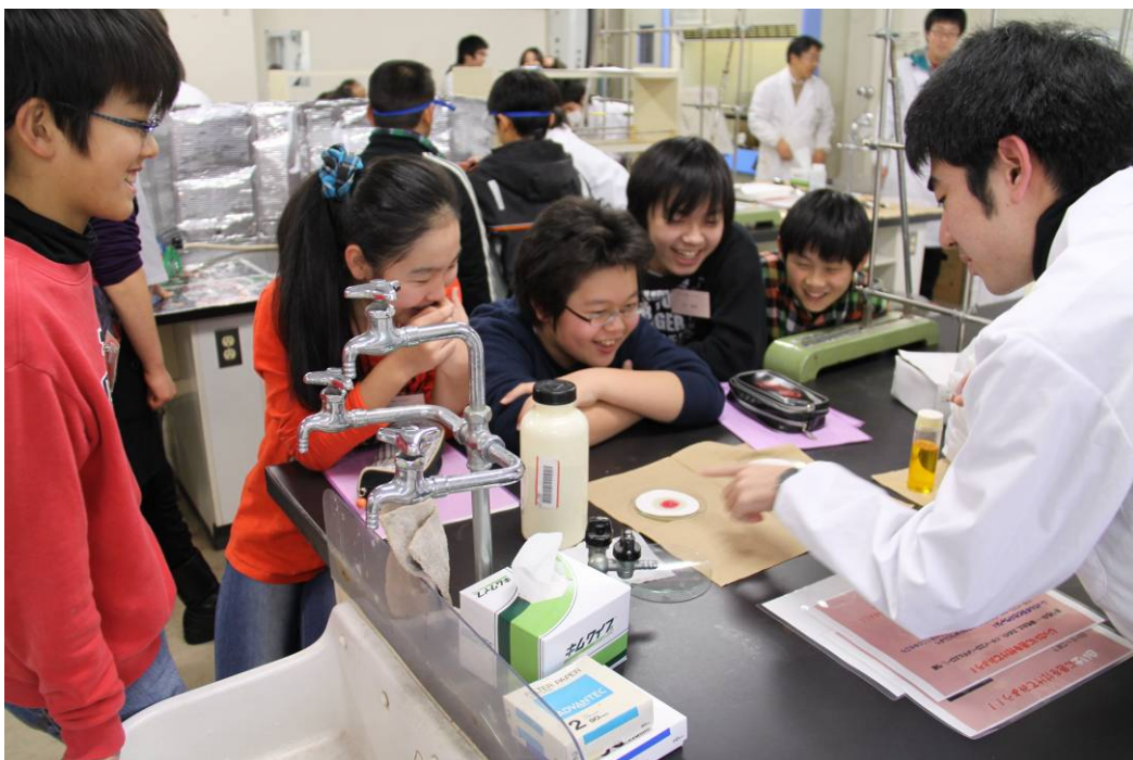
酸性白土に関する実験