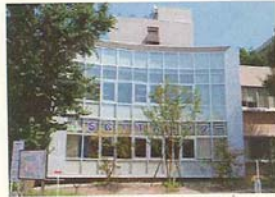
「SCITA」 Science for Tomorrow In our Area

お問い合わせ TEL.023-628-4506 〒990-8560 山形市小田川町1-4-12